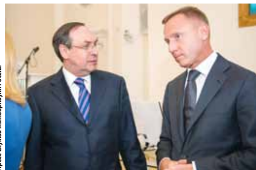
Пресс-служба Минобрнауки России

ОСОБОЕ ВНИМАНИЕ МЫ ДОЛЖНЫ УДЕЛИТЬ ДОСТУПНОСТИ КАЧЕСТВЕННОГО ОБРАЗОВАНИЯ ДЛЯ ДЕТЕЙ, ОКАЗАВШИХСЯ В ТРУДНОЙ ЖИЗНЕННОЙ СИТУАЦИИ, И ДЕТЕЙ С ОГРАНИЧЕННЫМИ ВОЗМОЖНОСТЯМИ, ПОСКОЛЬКУ БЕЗ ОБРАЗОВАНИЯ НЕВОЗМОЖНА ИХ ПОЗИТИВНАЯ СОЦИАЛИЗАЦИЯ.