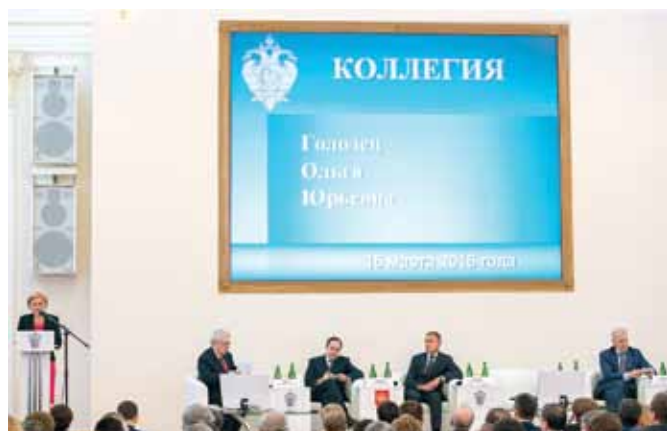
Пресс-служба Минобрнауки России