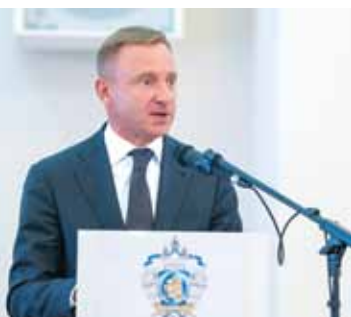
Пресс-служба Минобрнауки России

► Дмитрий Ливанов , министр образования и науки РФ